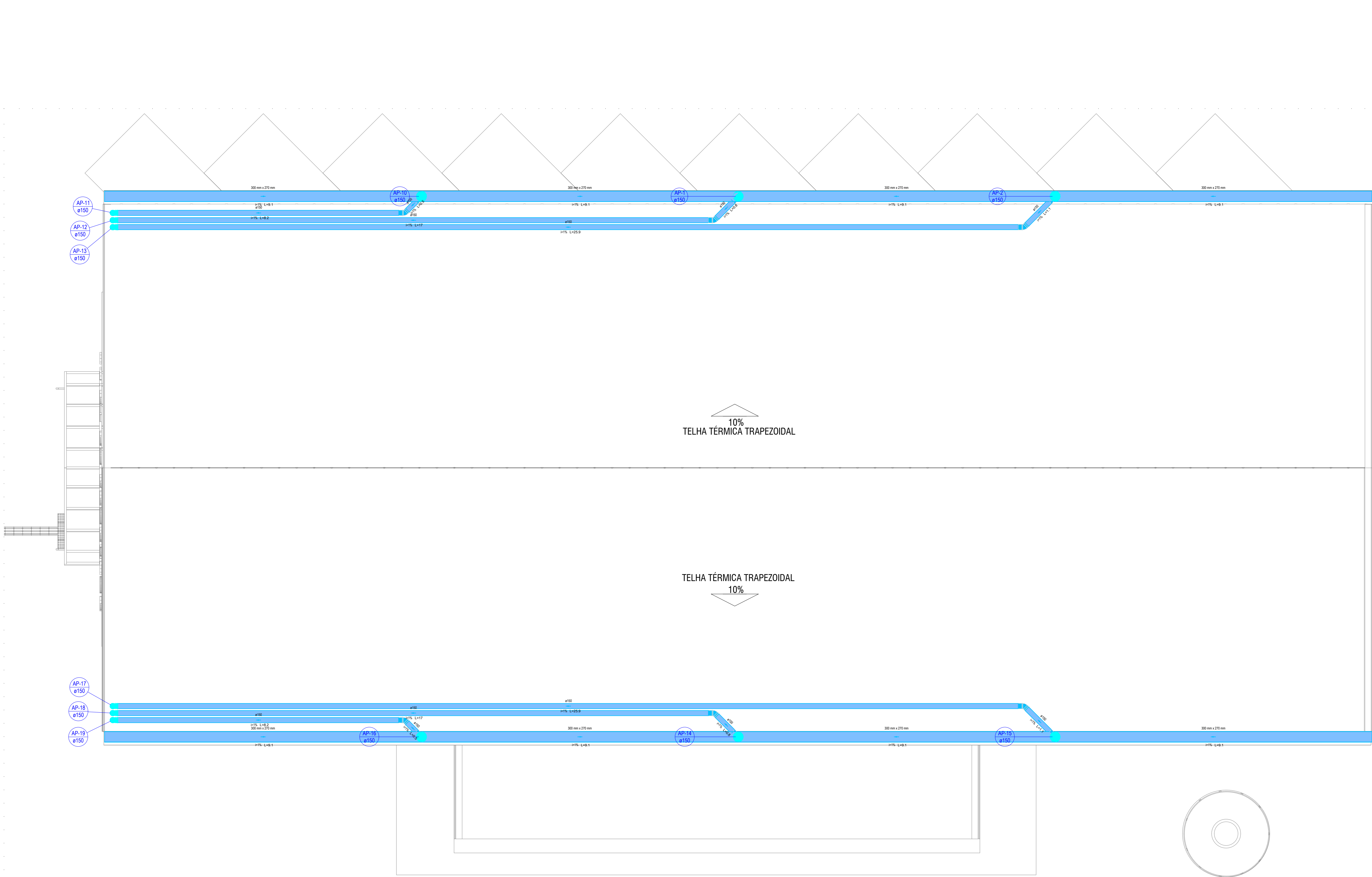
Detalhe COBERTURA FEIRA Escala 1:60